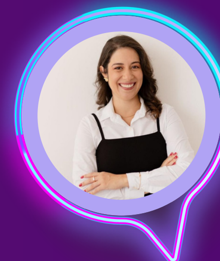
HELOISA MEDEIROS Agência Marandu