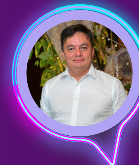
GUILBERTH GARCÊS Secretário de Estado de Articulação de Desenvolvimento