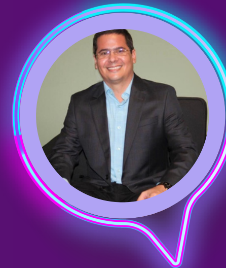
SAULO LIMA Secretário de Estado de Ciência, Tecnologia e Inovação